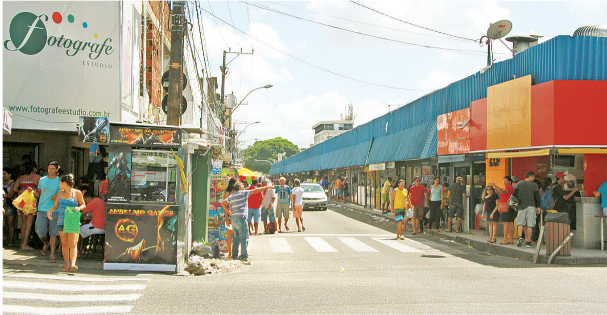
Comércio de rua estará fechado em todas as regiões da capital potiguar ao longo da próxima quarta-feira 7