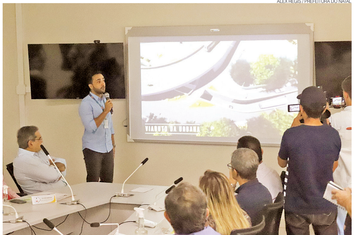
Prefeito Álvaro Dias, ao lado da equipe da STTU, apresentou detalhes do projeto para a avenida na última sexta

Ele também pede compreensão à população. “Todos terão um prejuízo inicial, até o momento em que vão aprender a fazer outros deslocamentos, por conta do projeto. Os primeiros 10 dias serão bastante difíceis para as pessoas da região da Felizardo Moura. Mas nós vamos acompanhar e criar alternativas para os motoristas”, informa o representante da STTU.●