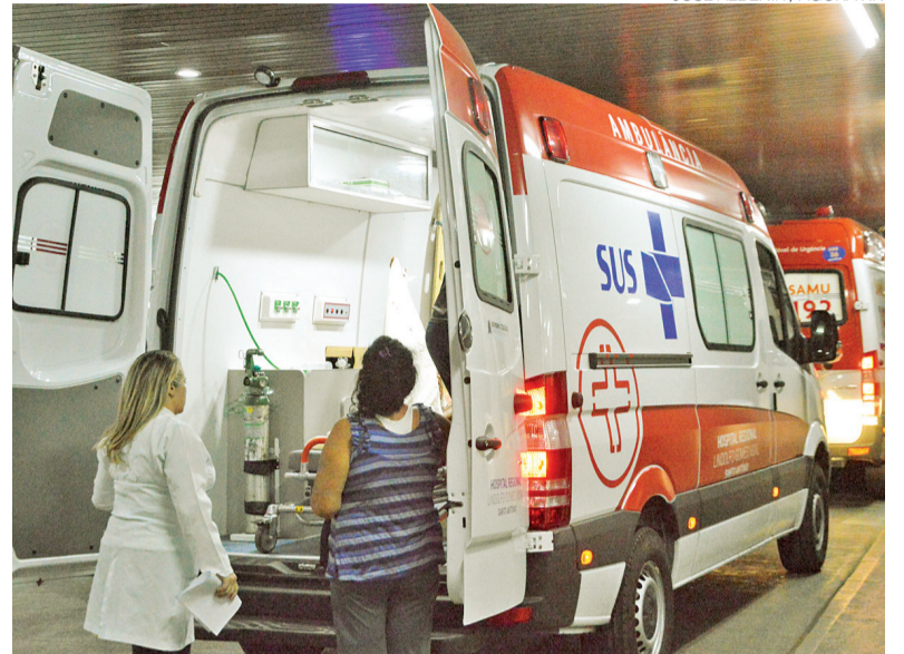
Conselhos trabalham em pactuação para a derrubada da liminar do STF

E CONTINUA: “A lei 14.434/2022 é um dispositivo constitucional que nos permitirá lutar para erradicar os salários historicamente miseráveis da categoria e estabelecer condição digna de vida e de trabalho para o maior contingente de profissionais de saúde do país – 2.710.421 trabalhadores. Os Conselhos de Enfermagem já estão trabalhando para pactuação de consensos que viabilizem a derrubada da liminar no STF, pois trata-se de uma demanda histórica da ca-