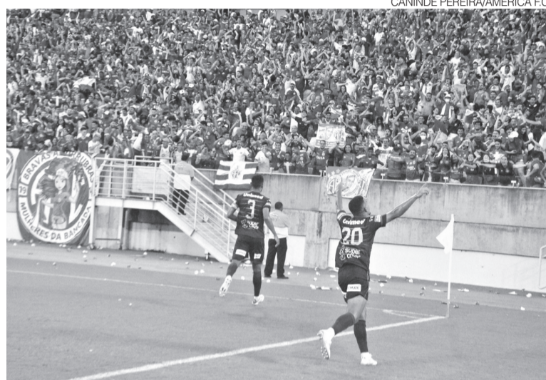
Com apoio da torcida, América sai na frente na luta por uma vaga na final