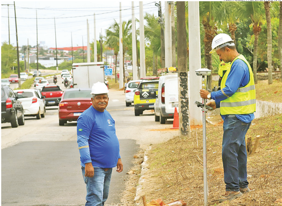
Trabalho de retirada e relocação de postes ao longo da via começou no domingo 4 e deve durar mais 15 dias

gião, já que mais de 75 mil veículos circulam diariamente pela via e o local é um dos principais corredores de transporte público da cidade, agentes de mobilidade da Secretaria Municipal de Mobilidade Urbana (STTU) estarão presentes em todos os momentos da obra. O projeto prevê a aplicação