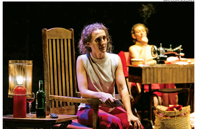
Espectáculos vêm sendo realizados em várias regiões do Brasil e no exterior

coletivo de artistas que há 21 anos integra, junto a outras referências teatrais, a cena artística de Campinas (SP). Desde 2000, realiza atividades fundamentais no fazer teatral que incluem diversos aspectos, como criação e circulação de espetáculos, ações formativas de curta e média duração e gestão do Espaço Cultural Rosa dos Ventos, sede do grupo desde 2008.