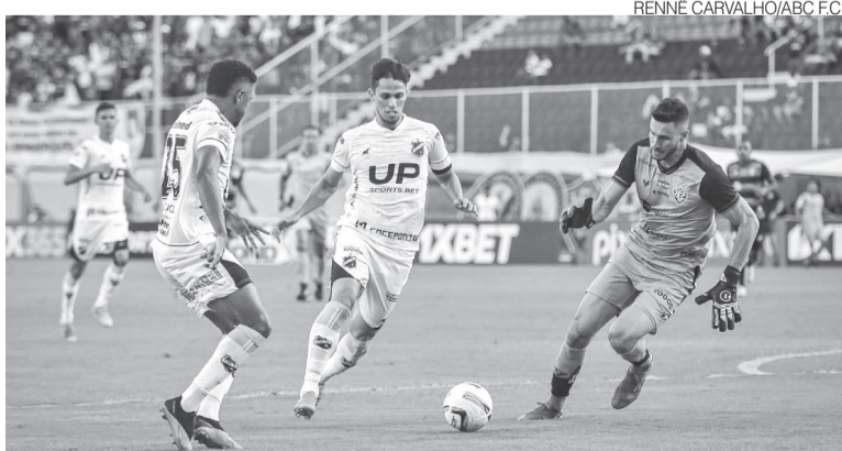
Partida sem gols aconteceu no fim de tarde deste domingo

tarde deste domingo 4, no Barradão, em Salvador, em partida válida pelo Campeonato Brasileiro de Futebol da Série C.