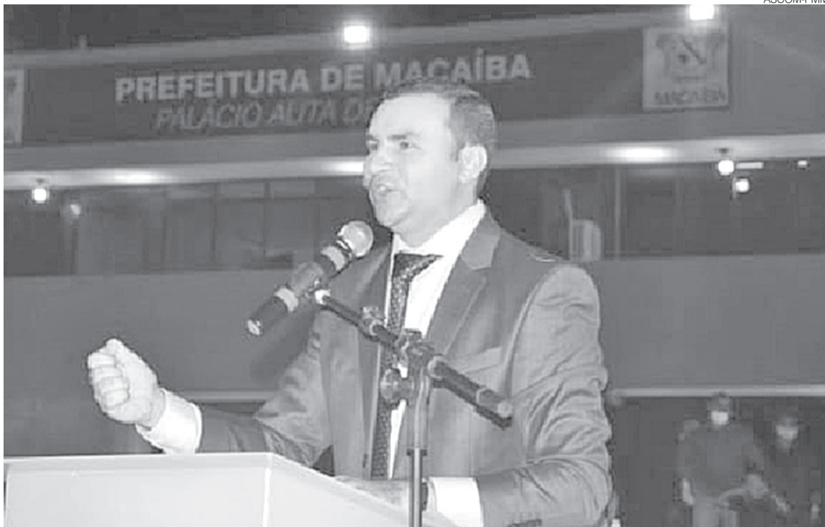
Prefeito Emídio Jr. vai assinar ordem de serviço para obra de asfalto de Capoeiras, maior comunidade negra do RN